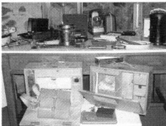
Museo de Olivenza: Futuro despacho del veterinario (2005)

La respuesta ha sido magnífica, como así lo demuestra las numerosas donaciones efectuadas por los veterinarios más antiguos, por la vocalía de jubilados del ICOVM y también por sus familiares y otras personas amantes de la medicina animal, lo que ha permitido incrementar notablemente los fondos del Museo de Veterinaria Militar, verdadero museo de las Ciencias Veterinarias de España.